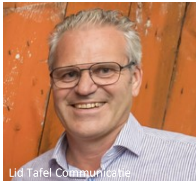
Lid Tafel Communicatie

Nu zijn we bezig met de voorbereiding voor ons nieuwe huis in Haven-