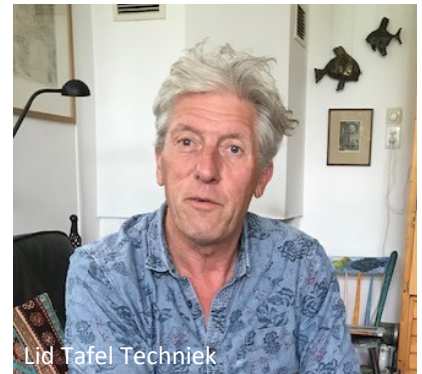
Lid Tafel Techniek

Ons huis, bouwjaar 1964, is door de vorige bewoners aangepakt en geïsoleerd. Wij hebben een aanbouw gezet met extra aandacht voor isolatie (vlas) en duurzaamheid. Het heeft een plat dak met zonnepanelen welke betaald zijn